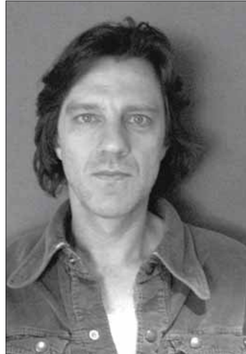
Режиссер фильма Джеймс Марш

6 августа 1974 года Филипп Петит прошел по канату от одной нью-йоркской башни-близнеца до другой. И не умер. «Man on Wire» - полудокументальный фильм, который описывает этот совершенно идиотский поступок и предварительную подготовку к нему